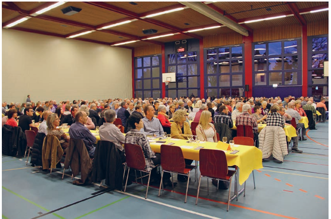
Die Bürgerversammlung 2016 war ausserordentlich gut besucht.