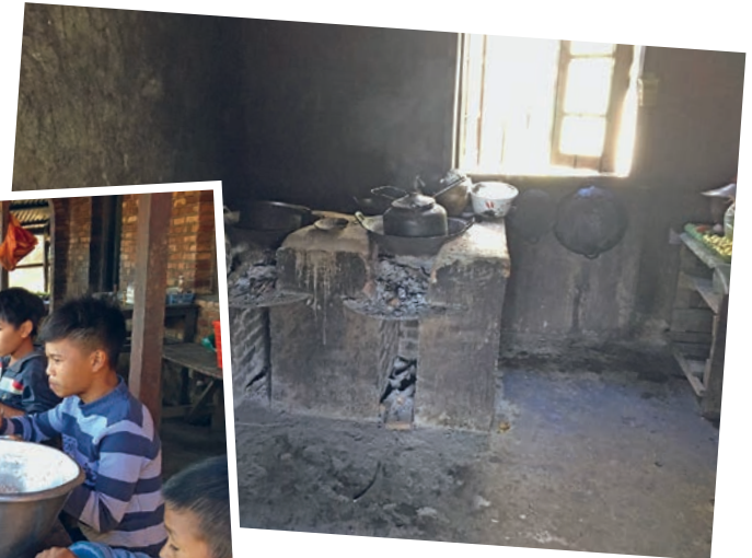
Die dringend sanierungsbedürftige Küche der Waisen- und Leprahilfe in Myanmar.