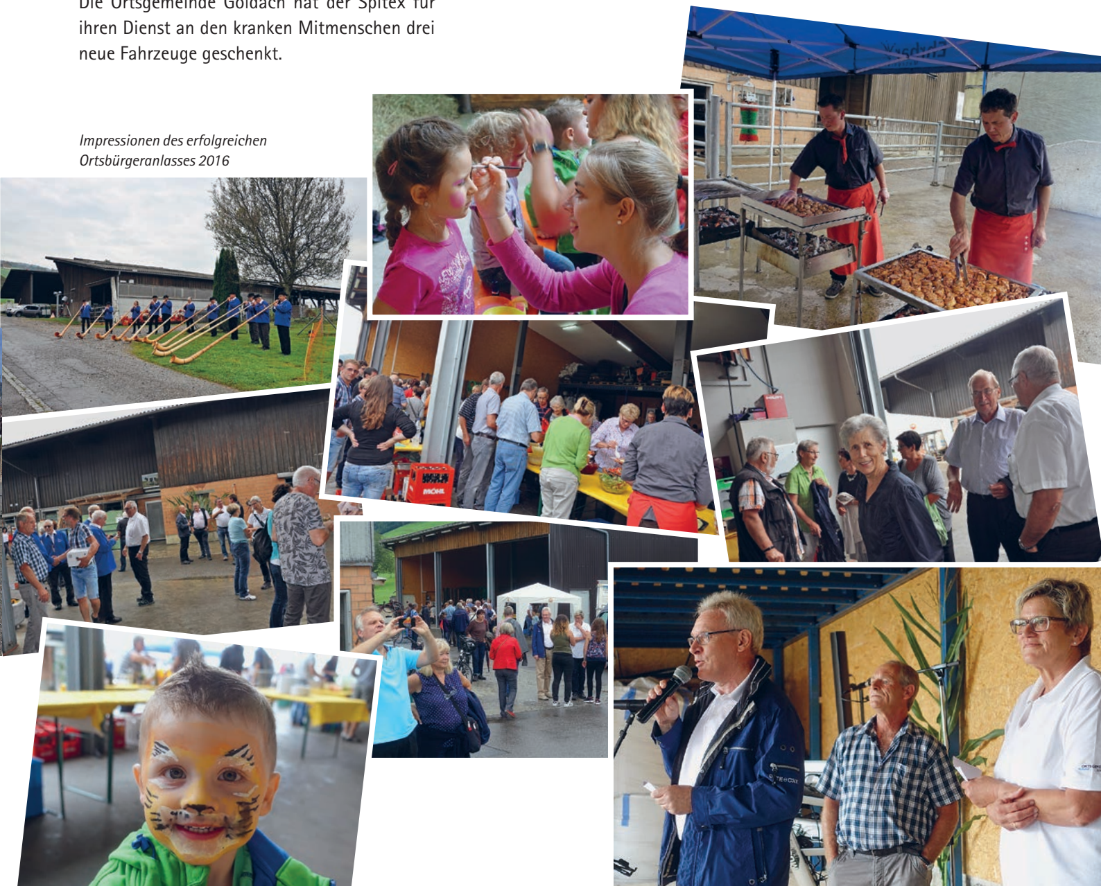
Impressionen des erfolgreichen Ortsbürgeranlasses 2016

Der Ortsbürgeranlass 2016 wurde am 20. August auf dem landwirtschaftlichen Betrieb der Ortsgemeinde Goldach an der Witenholzstrasse 10 durchgeführt. Die Familie Zeller hatte im Wagenschopf für ca. 300 Personen Tische und Bänke aufgestellt und diese schön geschmückt. Nach der Begrüssung und dem Apéro verwöhnte das Personal der Metzgerei Ehrbar die Gäste mit Grilladen und feinen Salaten. Zum Dessert stand eine grosse Auswahl an Patisserie bereit. Das Kinderprogramm wurde von Mitarbeiterinnen der Kindertagesstätte Goldach gestaltet. Zur musikalischen Unterhaltung trat eine Tiroler Musik auf, welche es vorzüglich verstand, unter den Gästen eine gemütliche Stimmung zu verbreiten und zum Tanz aufzuspielen.