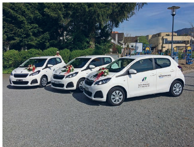
Die Ortsgemeinde hat drei dringend benötigte Fahrzeuge für die Spitex finanziert.

Die Landumlegung Thannäcker wurde vom 1. Juni bis 30. Juni 2016 öffentlich aufgelegt. Mehrere Einsprachen sind erfolgt. Der Verwaltungsrat musste ebenfalls vorsorglich Einsprache erheben, um Dienstbarkeiten zu bereinigen. Momentan muss noch eine geregelt werden, bis die Einsprache vollumfänglich zurückgezogen werden kann.