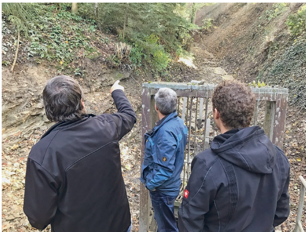
Bei der Liegenschaftsbegehung wurde auch die notwendige Sanierung des Eschenbachs besprochen.

len Informationen an der WUGA präsentieren konnte. Der Verwaltungsrat bedankt sich bei Konrad Metzger und Matthias Schmid für ihren jahrelangen grossen Einsatz zum Wohle der Ortsgemeinde und wünscht ihnen für die Zukunft alles Gute.