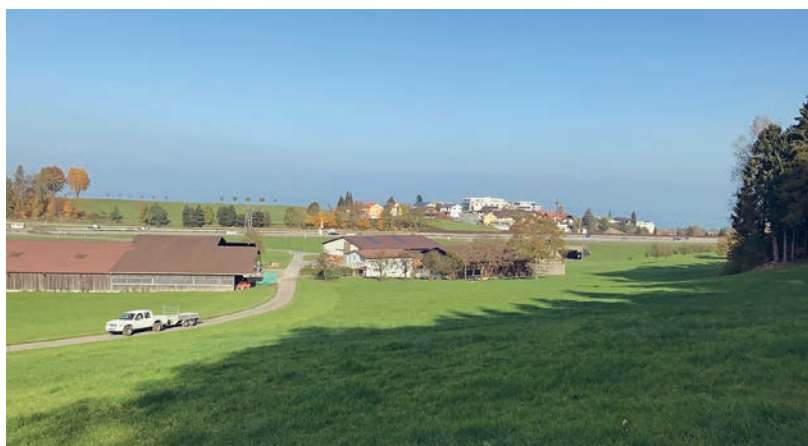
In den ersten drei Monaten 2017 wird das Wohnhaus der Siedlung Witen einer umfassenden Innensanierung unterzogen.

Im Eschlenwald konnten die nötigen Unterhaltsarbeiten, wie Rechen entleeren und Gehölz aus den Bachböschungen entfernen, vorgenommen werden.