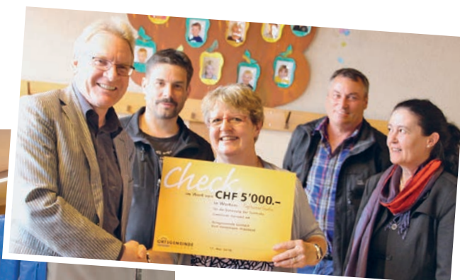
Checkübergabe an die Gemeinde Hundwil für die Sanierung der Turnhalle.